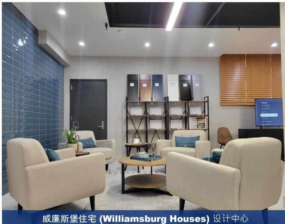
威廉斯堡住宅 (Williamsburg Houses) 设计中心

我们的演示并不是您家庭的最终工作范围，而是居民可以进一步完善的各种选项的初始“ 菜单 ”。 我们的目标 是展示创意和解决方案，并作为真正的 合作伙伴与您合作 ，为 您的家庭 确定最佳结果。我们将创建一个现场 Bay View 设计中心 ，用于实际决策过程。