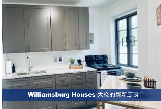
Williamsburg Houses 大楼的翻新厨房