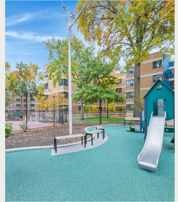
新大楼入口 & 户外空间