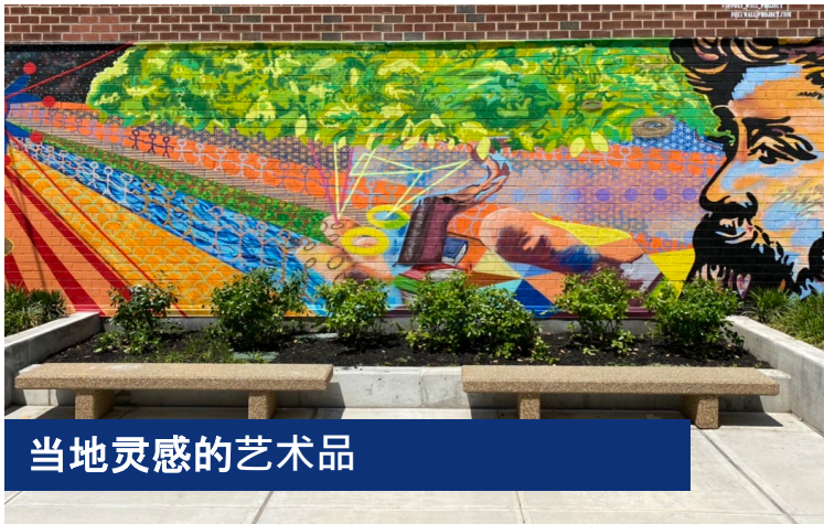
当地灵感的艺术品