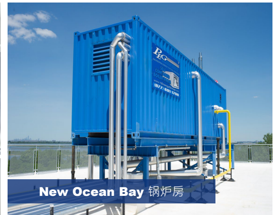
New Ocean Bay 锅炉房