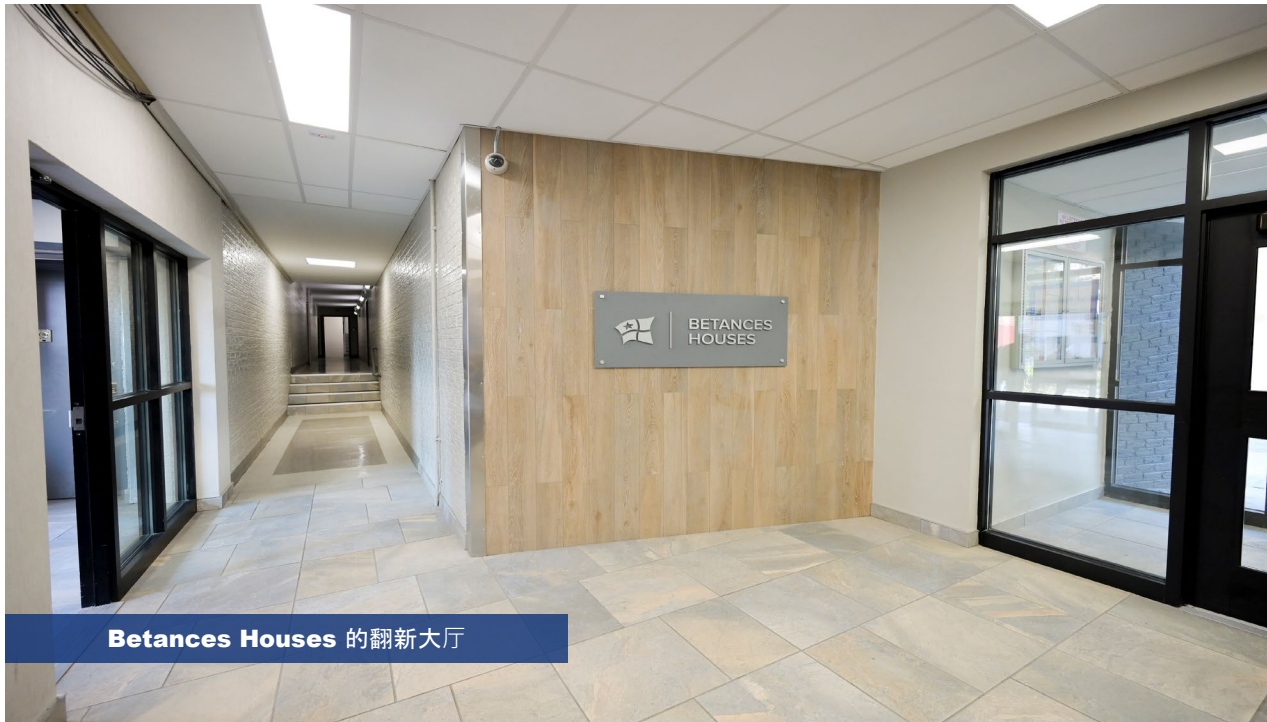
Betances Houses 的翻新大厅