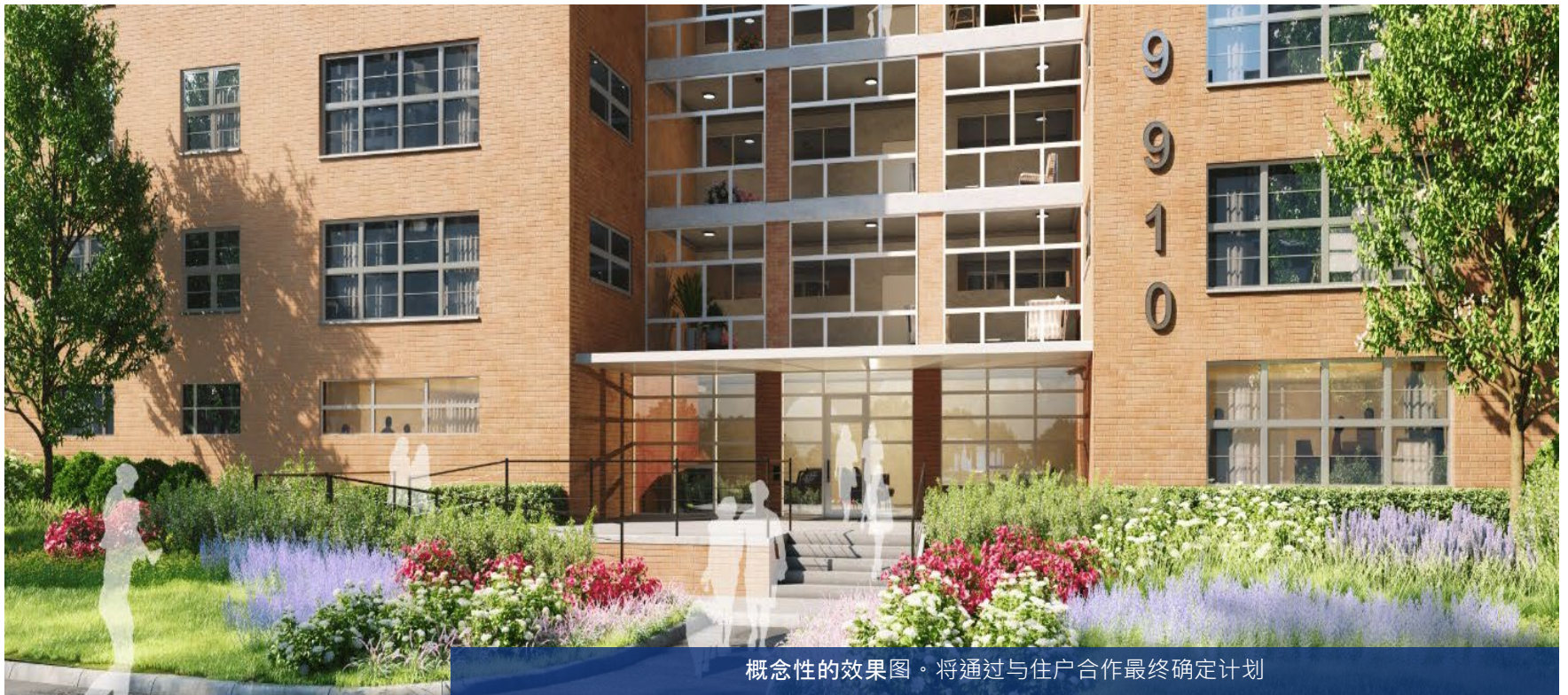
概念性的效果图。将通过与住户合作最终确定计划