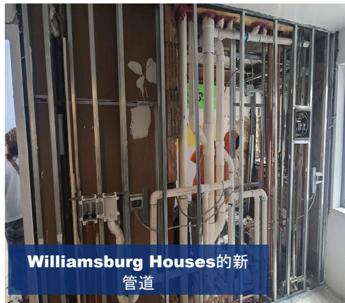
Williamsburg Houses 的新管道