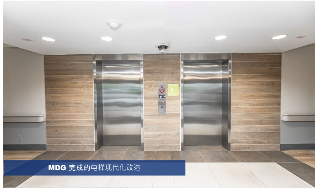
MDG 完成的电梯现代化改造