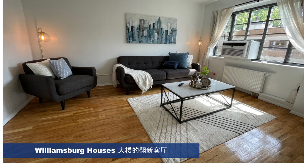
Williamsburg Houses 大楼的翻新客厅