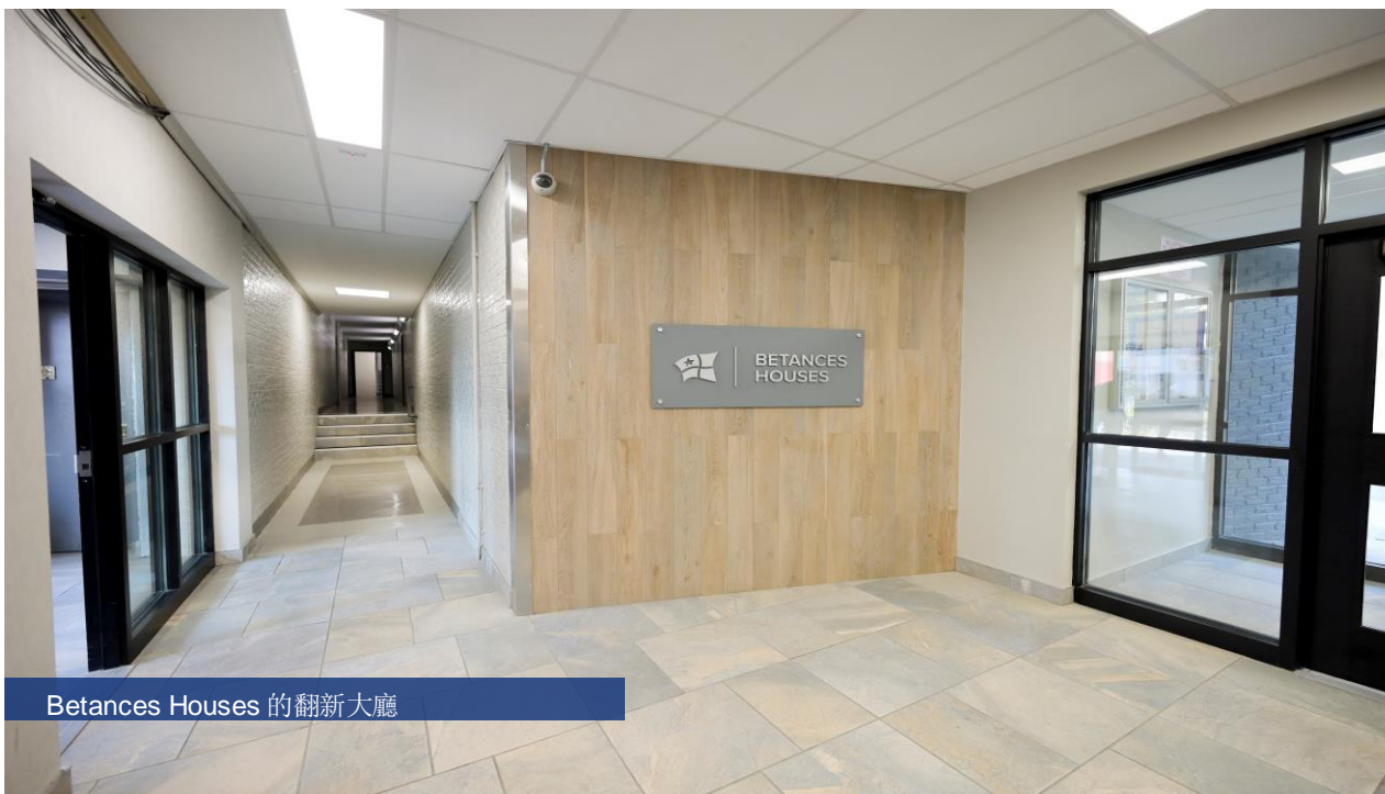
Betances Houses 的翻新大廳