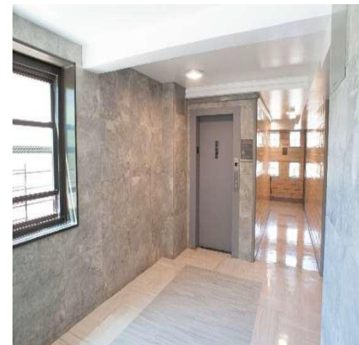
大洋灣 (Bayside) 翻新建築入口