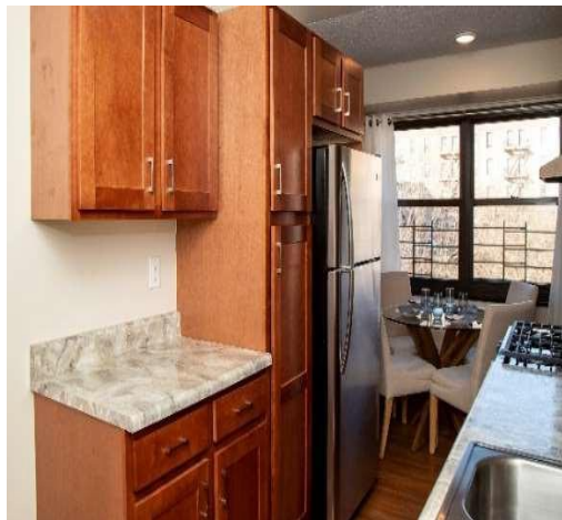
雙子公園西(Twin Parks West) 翻新公寓