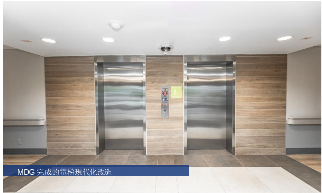
MDG 完成的電梯現代化改造