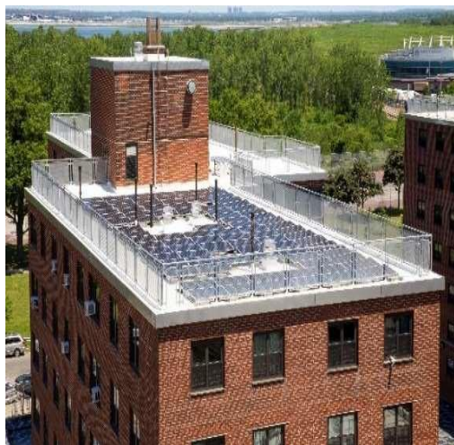
大洋灣 (Bayside) 修復的屋頂和太陽能電池板系統