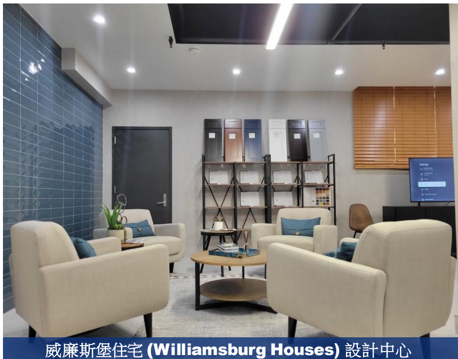
威廉斯堡住宅 (Williamsburg Houses) 設計中心

我們的演示並不是您家庭的最終工作範圍，而是居民可以進一步完善的各種選項的初始“功能表”。我們的目標是展示創意和解決方案，並作為真正的合作夥伴與您合作，為您的家庭確定最佳結果。我們將創建一個現場 Bay View 設計中心，用於實際決策過程。