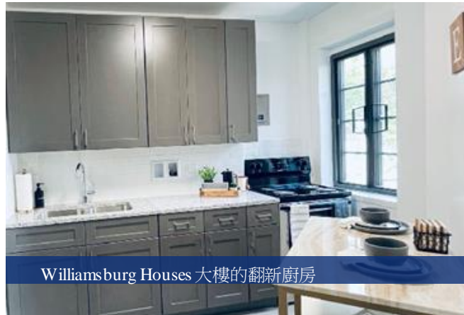
Williamsburg Houses 大樓的翻新廚房