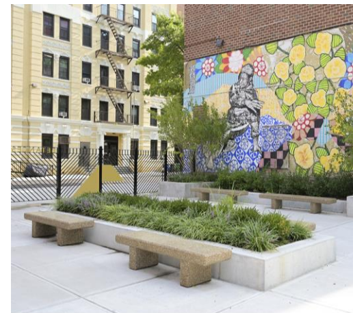
貝斯坦 (Betances) 公共區域改善