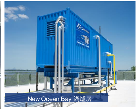
New Ocean Bay 鍋爐房