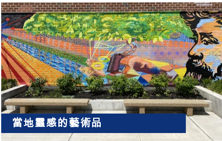
當地靈感的藝術品