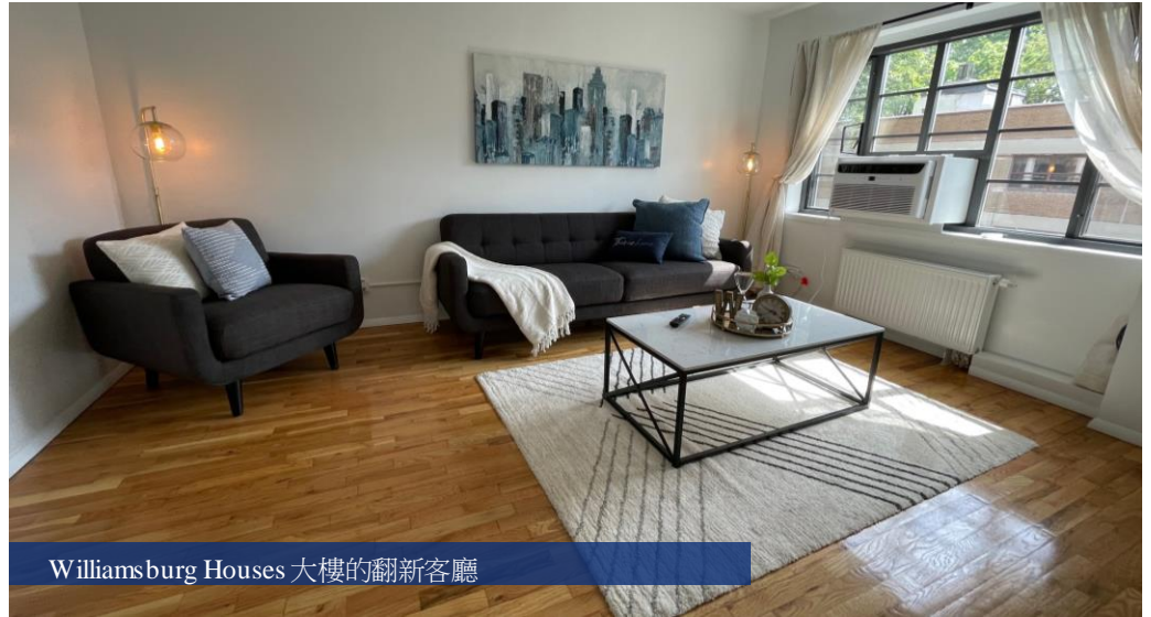
Williamsburg Houses 大樓的翻新客廳