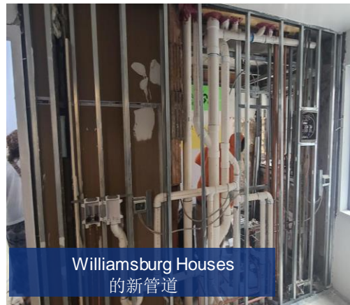
Williamsburg Houses 的新管道